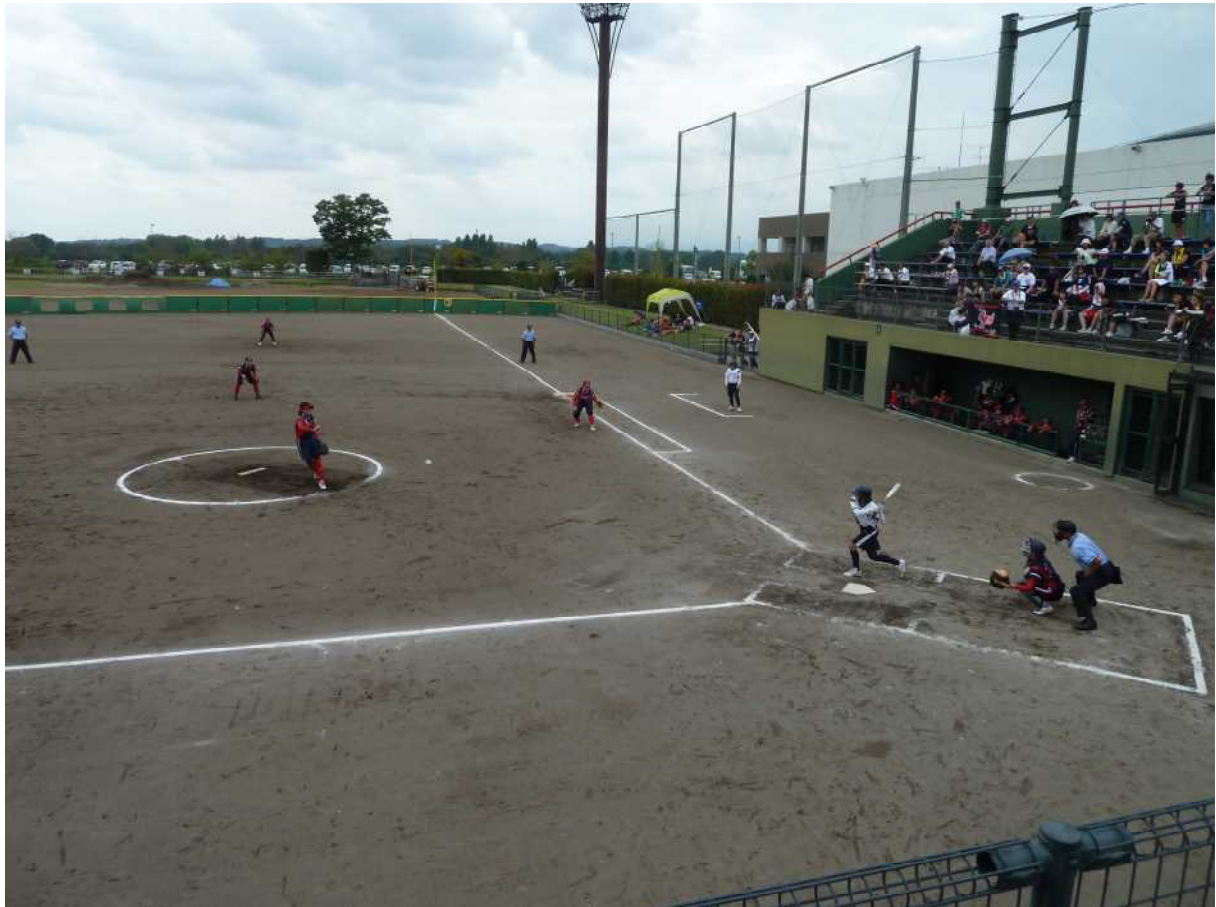
第22回全日本レディースソフトボール大会 決勝戦 埼玉県鴻巣市吹上総合運動場 KEICHO CLUB (三重県) 対 とべスワロー (愛媛県)